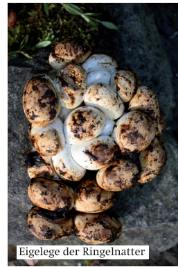
Eigelege der Ringelnatter

Gefahr besteht nicht. Am besten sollte man die streng geschützten Tiere in Ruhe lassen und sich freuen, sie beobachten zu können. Der NABU empfiehlt, Ringelnatter und Schlingnatter im Garten zu helfen. So kann man mit der Anlage von sonnigen Holz-, Stein- und Komposthaufen ideale Brutmöglichkeiten für Ringelnattern schaffen. Ein strukturreicher Garten mit Sträuchern, Gehölzen, alten Baumstümpfen und lückigen Steinhaufen bietet zudem viele Unterschlupfmöglichkeiten und Winterquartiere für die Schlangen.