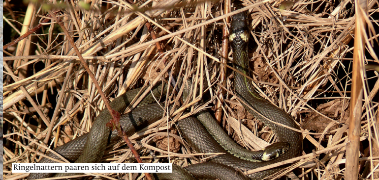
Ringelnattern paaren sich auf dem Kompost