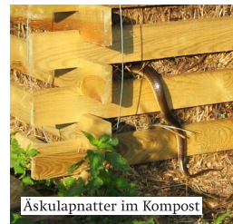
Äskulapnatter im Kompost