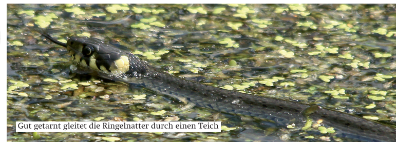
Gut getarnt gleitet die Ringelnatter durch einen Teich

Besonderheiten: Die Ringelnatter schwimmt und taucht ausgezeichnet. Sie sonnt sich lange im Uferbereich. Beim Ergreifen verspritzt die Ringelnatter ein stinkendes Sekret.