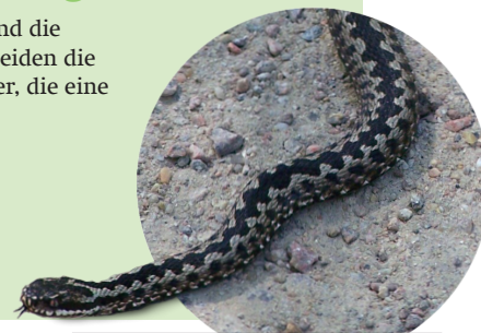
Durchgehendes Zickzackband der Kreuzotter