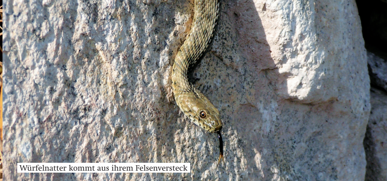
Würfelnatter kommt aus ihrem Felsenversteck