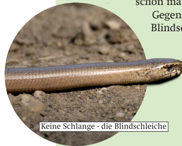
Keine Schlange - die Blindschleiche

Auch wenn sie keine Beine hat – die Blindschleiche zählt zu den Eidechsen. Ein wichtiges Unterscheidungsmerkmal sind die beweglichen Augenlider. Oder haben Sie schon mal eine Schlange zwinkern gesehen? Im Gegensatz zu den Schlangen ist der Kopf der Blindschleichen nicht vom Körper abgesetzt. Der Schwanz kann bei Gefahr abgeworfen werden, was Fressfeinde ablenkt und der Blindschleiche eine Chance zum Entkommen gibt. Haben Sie Blindschleichen im Garten? Schätzen Sie sich glücklich, denn Nacktschnecken sind für die Tiere ein Leckerbissen!