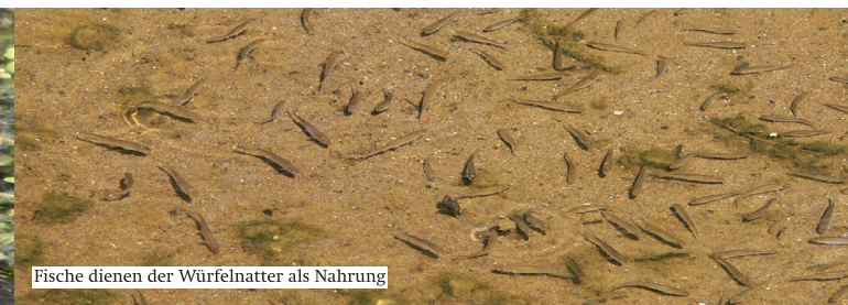
Fische dienen der Würfelnatter als Nahrung

Besonderheiten: Die Würfelnatter kann ausgezeichnet schwimmen und tauchen und verbringt viel Zeit im flachen Wasser. Nur zum Sonnenbaden, zur Fortpflanzung und zur Überwinterung verlässt sie das Gewässer. Bei Bedrohung verspritzt die Würfelnatter ein übel riechendes Sekret.